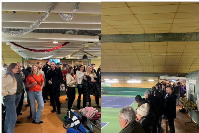
"Publik under KM-veckan".

Sammanfattningsvis visar breddverksamheten att ÅTK erbjuder ett komplett utbud för vuxna motionärer, från kurser och abonnemang till sociala aktiviteter, gruppspel och KM, vilket stärker både klubbkänslan och engagemanget i hallen.