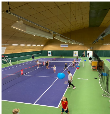
Glada barn under tennisens dag där hela familjen fick prova på.

Juniorverksamheten präglas av glädje, utveckling och gemenskap. Genom variationen av träning, tävling, läger och fritidsaktiviteter skapar ATK en miljö där alla barn och ungdomar kan trivas, utvecklas och känna stolthet över sitt engagemang i klubben, oavsett ambition eller nivå.