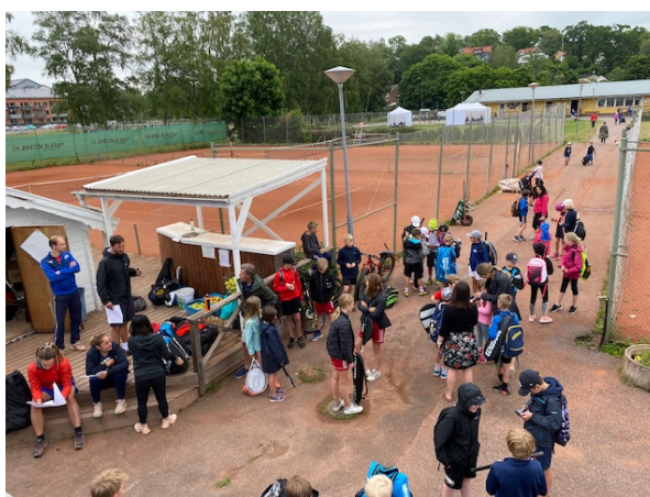
Sommarläger på tennisklubben

Det är viktigt för ÅTK:s juniorverksamhet är att erbjuda alla tennisintresserade barn/ungdomar en vettig och sund fritid. Att ta vara på den enskilde individens mål/drömmar som tennisspelare och vara behjälplig så långt som föreningens resurser tillåter. Utöver juniorverksamheten med en tränare och en grupp försöker ÅTK att locka fler barn att spela flera tillfällen i veckan. För att stödja det så arrangerade ÅTK ett antal "fredagsmyskvällar". Hinderbanor, minitennisplaner och föräldrar som ledare finns där och hjälper alla att komma igång med denna organiserade spontanaktivitet. Matchspelskvällar för röd, orange och grön nivå arrangerades under året i syfte att låta fler barn komma till matchspel. Matchspelskvällarna skapar en social samvaro med mindre fokus på resultat. Saft och bulle eller korv, bröd och popcorn som avslutning är populärt inslag för barnen.